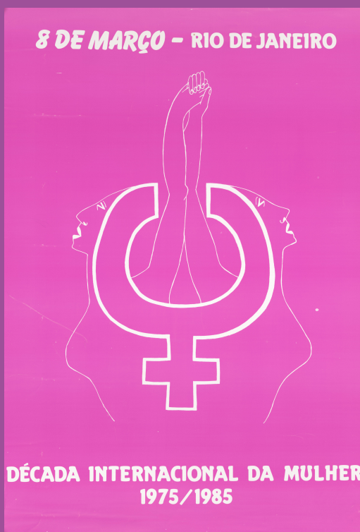
Cartaz Década Internacional da Mulher (1975-1985)