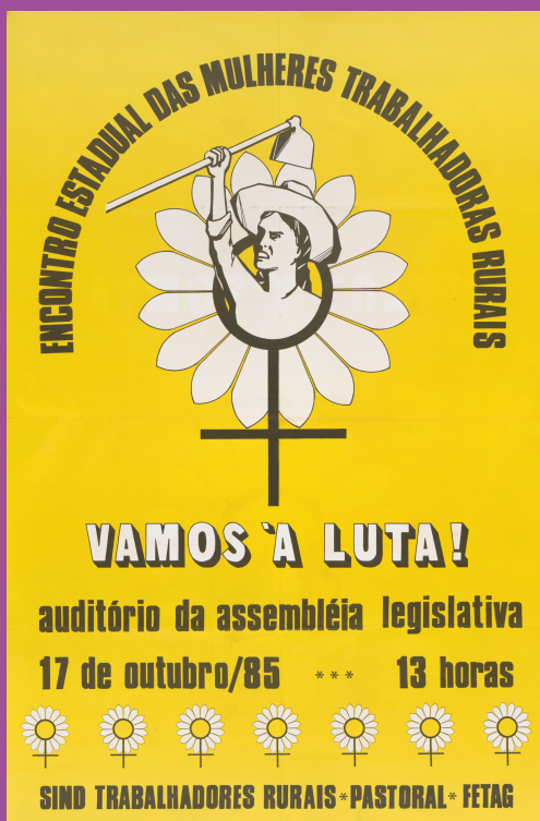
Cartaz do Encontro Estadual do Movimento das Mulheres Trabalhadoras Rurais (1985)

A Galeria CRESS, expressa no decorrer de toda a sétima edição da revista Emancipa: Nós, mulheres, assistentes sociais de luta!, trará registros das muitas frentes coordenadas pelas mulheres no Brasil.