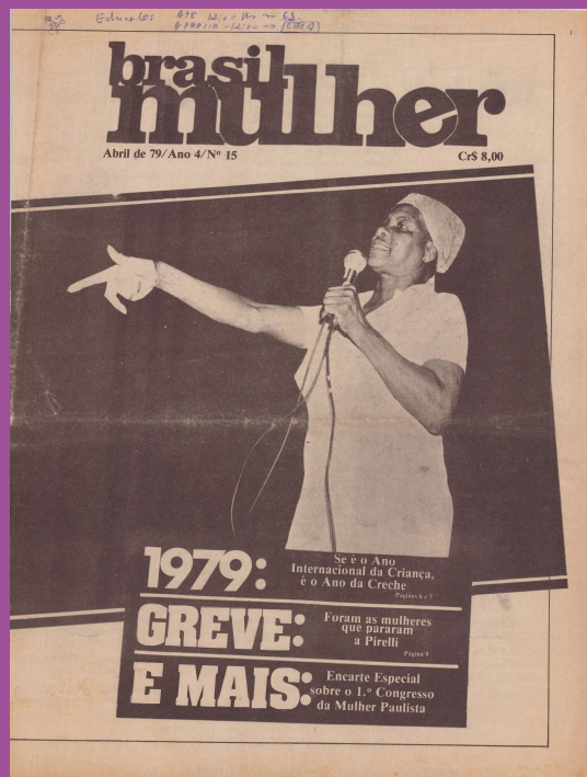
Jornal Brasil Mulher. Ano 4, n. 5, 1979.