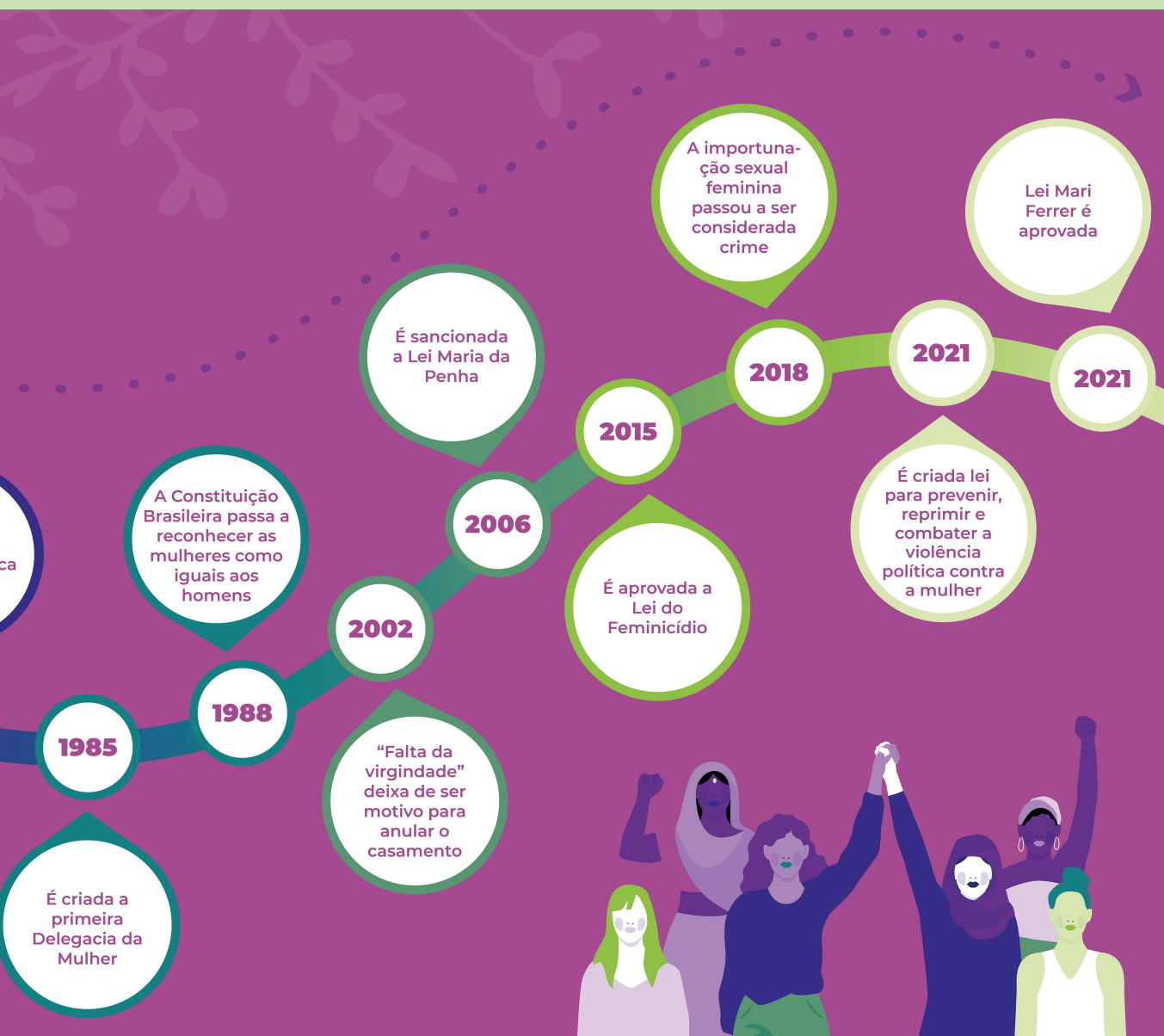
Linha do tempo da história dos direitos das mulheres no Brasil