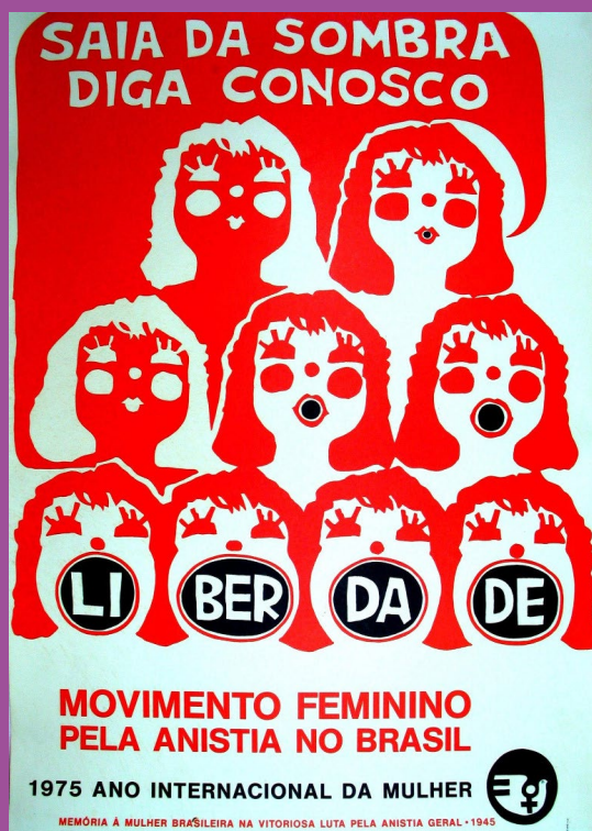
Cartaz do Movimento Feminino pela Anistia no Brasil - Acervo CEDEM-UNESP, Saia da sombra.

A Galeria CRESS, expressa no decorrer de toda a sétima edição da revista Emancipa: Nós, mulheres, assistentes sociais de luta!, trará uma homenagem a momentos históricos feministas.